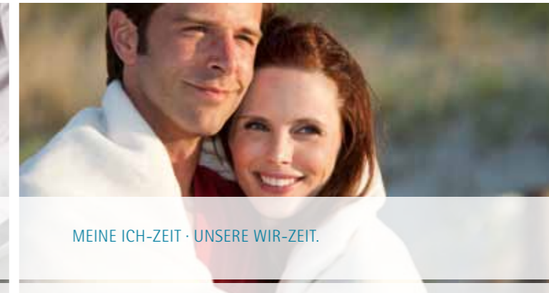
MEINE ICH-ZEIT · UNSERE WIR-ZEIT.

Wir laden Sie ein zu einem ausführlichen Vitalitätscheck, um gezielte Behandlungen und Angebote auf Ihre individuellen Bedürfnisse abzustimmen.