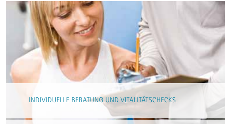
INDIVIDUELLE BERATUNG UND VITALITÄTSCHECKS.

Wir laden Sie ein zu einem ausführlichen Vitalitätscheck, um gezielte Behandlungen und Angebote auf Ihre individuellen Bedürfnisse abzustimmen.