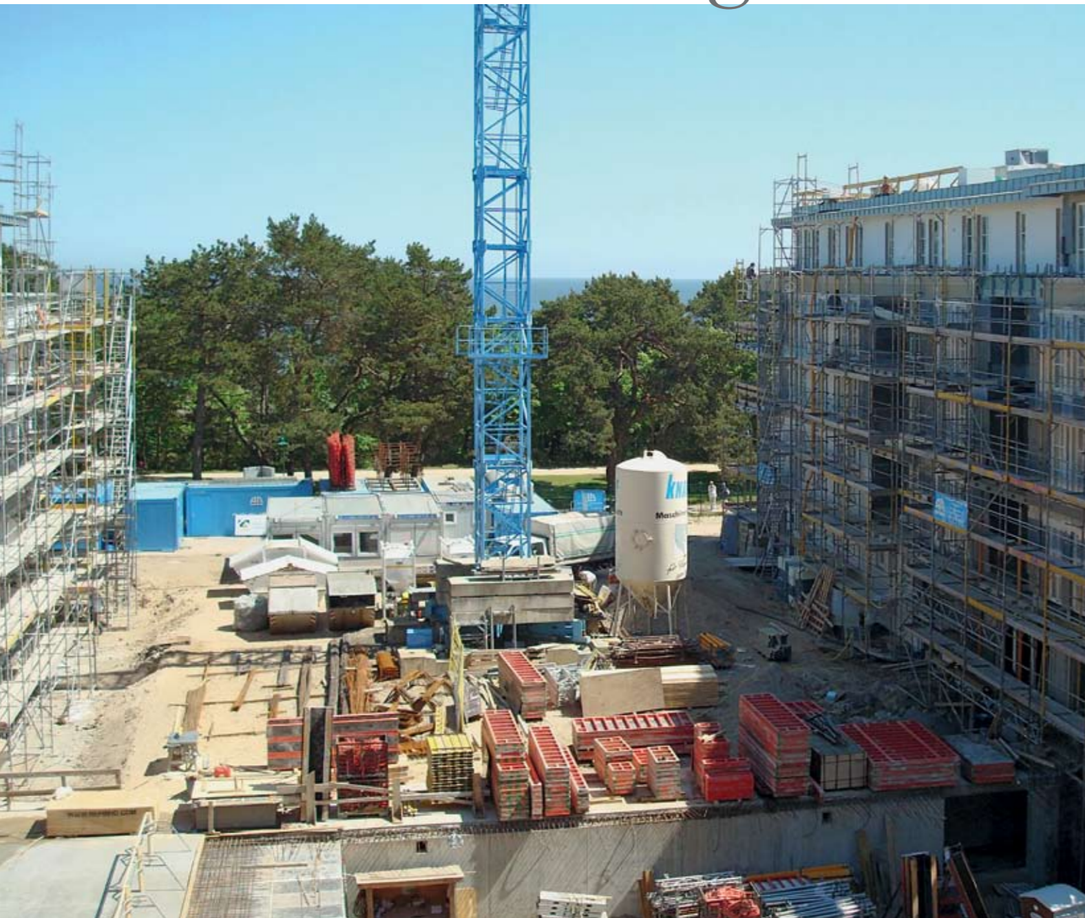
Die Baustelle des Steigenberger Grandhotel and Spa Heringsdorf im Sommer 2010