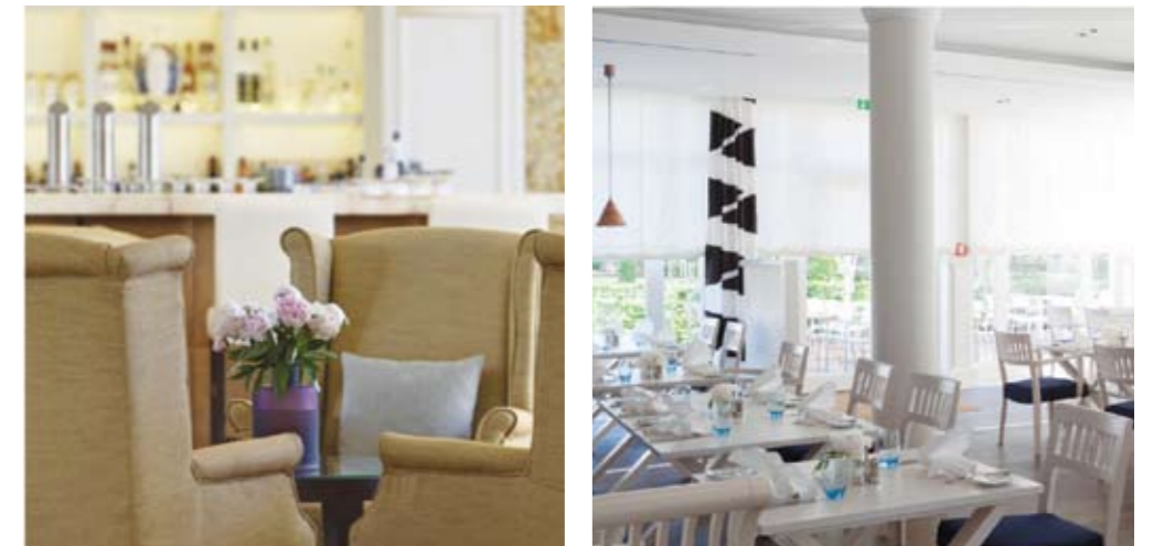
In den Restaurants des Steigenberger Grandhotel & Spa Heringsdorf können Sie die Köstlichkeiten genießen. Von links nach rechts und oben nach unten: Restaurant "Lilienthal", Vinothek, "Delbrück" Bar und Restaurant "Waterfront".