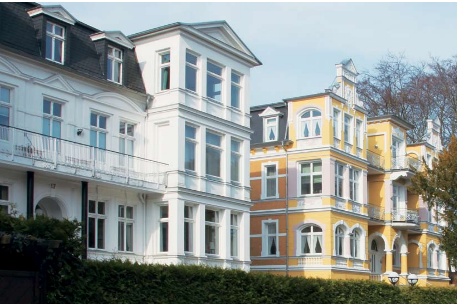
Häuserzeile mit typischer klassizistischer Architektur in Heringsdorf