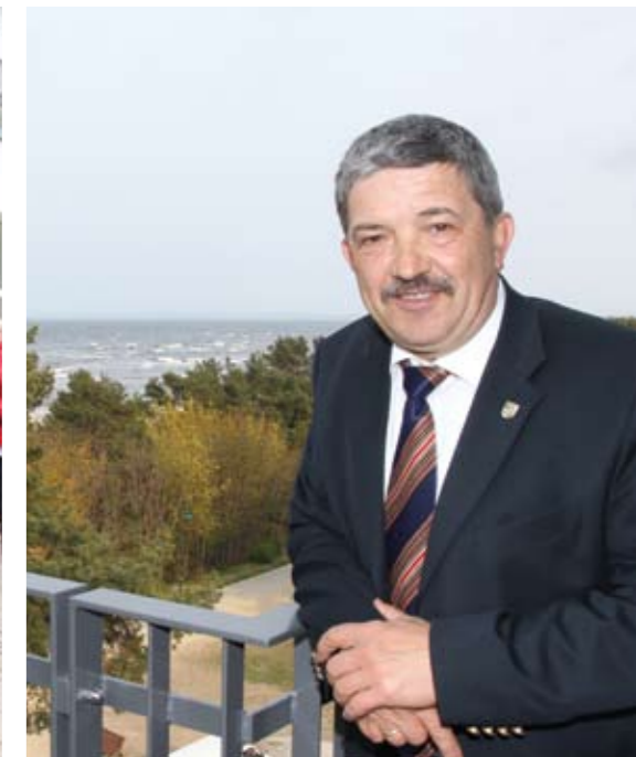
Lorenz Caffier, Innenminister von Mecklenburg-Vorpommern, zu Besuch auf der Terrasse mit Ausblick