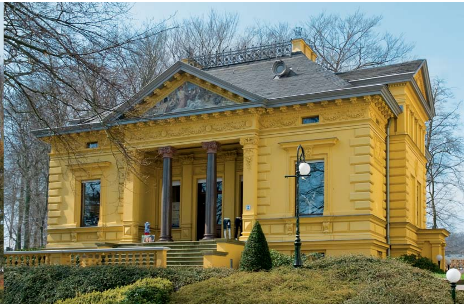
Typische Bäderarchitektur auf Usedom