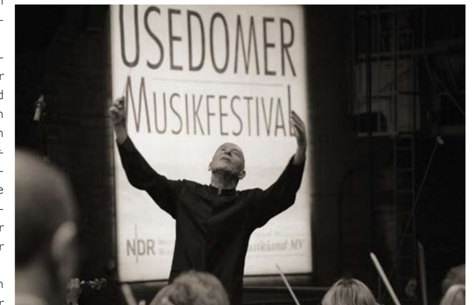
Wie jedes Jahr bietet das Usedomer Musikfestival unverwechselbare musikalische Angebote.

Das festivaleigene Baltic Youth Philharmonic Orchestra hat ebenfalls ein Werk von Čiurlionis auf seinem Konzertprogramm am 1.10. im Kraftwerk des Museums Peenemünde. Das Jugendsinfonieorchester nimmt das Publikum auf eine musikalische Reise durch den Ostseeraum mit und stellt unter der Leitung von Kristjan Järvi Werke von Komponisten aus allen mit der Ostsee verbundenen Staaten vor.