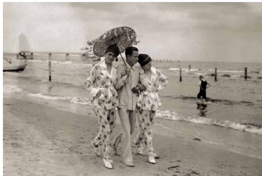
1918: Strandspaziergang in Heringsdorf

Die in der zweiten Hälfte des 19. Jahrhunderts bis zum 1. Weltkrieg entstandenen Bauten in den Seeheilbädern Ahlbeck, Heringsdorf und Bansin spiegeln einen ganz bestimmten Zeitgeist wider. Es sind Einrichtungen, die speziell für den Sommeraufenthalt an der See errichtet wurden. Die Bauherren konnten ihren architektonischen Wünschen, je nach Geldbeutel, freien Lauf lassen. Ob in Anlehnung an französische Renaissancepaläste, an Klassizismus oder nach italienischem Vorbild, die Sommerresidenzen übertrafen sich gegenseitig in Gestaltung und Glanz und waren ein Spiegelbild der gesellschaftlichen Stellung des Bauherren. Pompö-