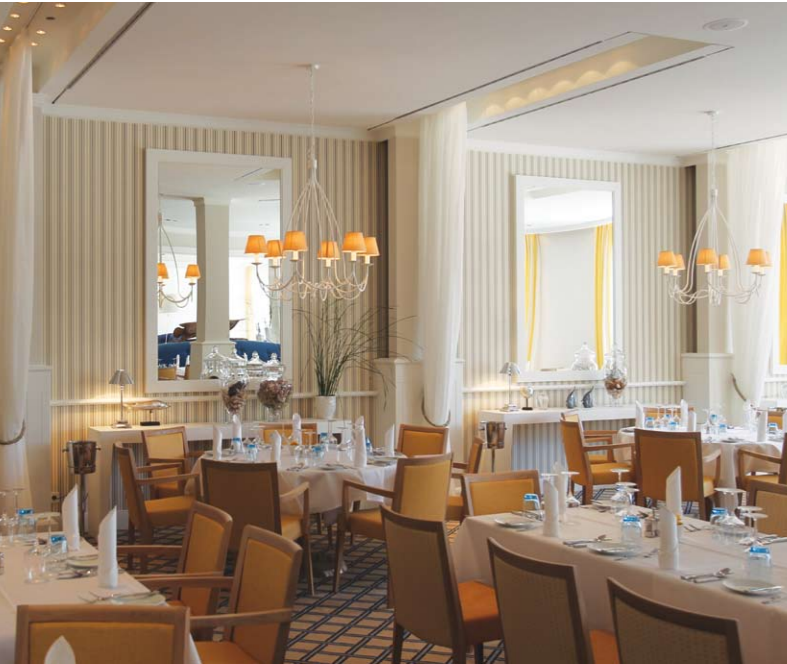
Restaurant Lilienthal: Geschirr, Glas und Besteck für höchste Ansprüche

Die Kochkunst des Steigenberger-Küchenteams endet nicht an den Pendeltüren zum Gastbereich. Seine Kreativität kommt erst richtig zur Entfaltung, wenn auf außergewöhnlichem Porzellan serviert wird. So ist es nicht verwunderlich, dass für die Gaumenfreuden der Gäste nur Geschirr, Glas und Besteck für höchste Ansprüche ausgesucht wurden. Die Hotelgäste werden in Zukunft von Tellern essen, die aus der Manufaktur Tafelstern (ehemals Hutschenreuther) kommen, die Bestecke sind von WMF – der Firma, die seit mehr als 150 Jahren einen weltweiten Namen genießt. Damit ist eigentlich alles gesagt, denn für die Urlauber und Einheimischen im Steigenberger Grandhotel and Spa in Heringsdorf ist das Beste gerade gut genug.