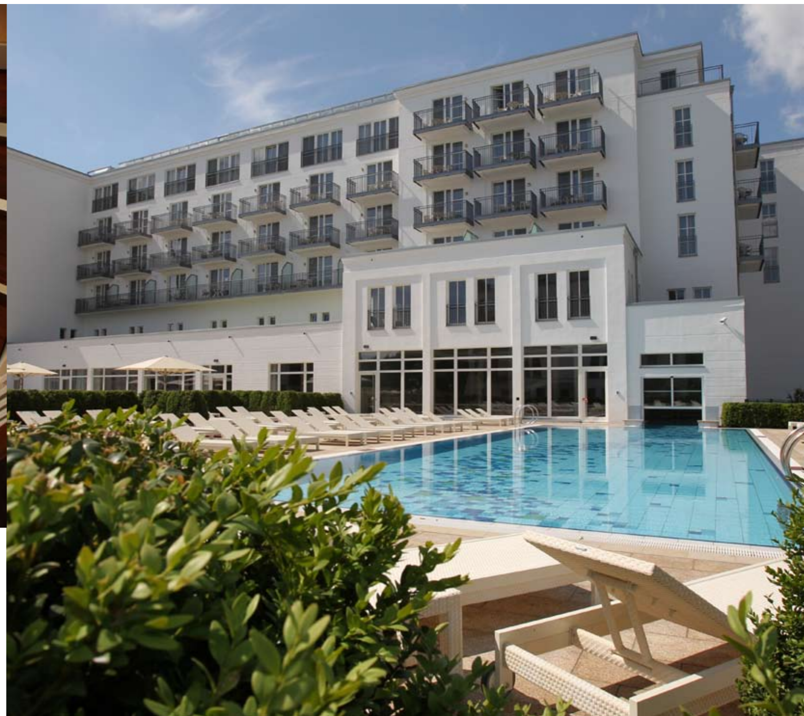
Entspannung pur im 2.000 Quadratmeter großen Luxus-Spa-Bereich des Steigenberger Grandhotel and Spa Heringsdorf

Am 27. Mai 2011 feierte das luxuriöse Wellness-Resort Eröffnung.