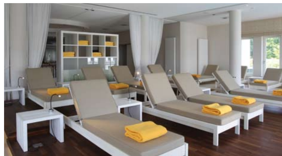
Das Motto lautet: „Sich selbst erfahren – spüren – und ganz für sich Zeit haben“.

Im 2.000 Quadratmeter großen Luxus-Spa entspannen und gepflegt auf der sonnigen Restaurantterrasse mit Blick auf die 10 Kilometer lange Strandpromenade speisen – das alles und noch viel mehr können die Gäste des Steigenberger Grandhotel and Spa seit Ende Mai 2011.