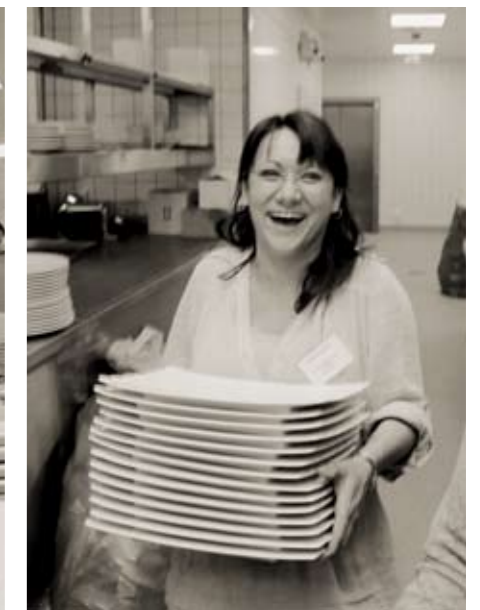
Bis zu 60 Mitarbeiter aus allen Bereichen des Steigenberger-Teams halfen beim Auspacken, Sortieren, Spülen und Polieren.